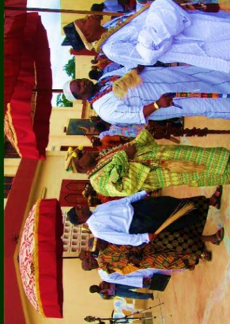
ROUTE DES ROIS / ABENGOUROU / COTE D'IVOIRE