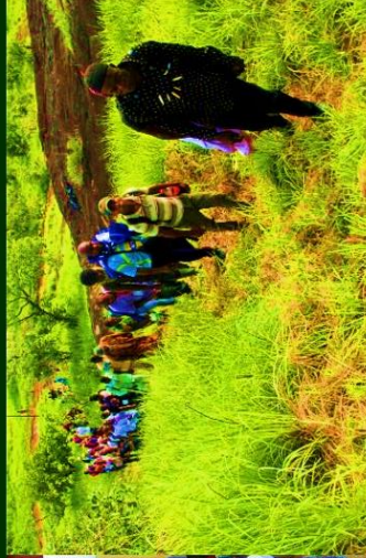
Pèlerinage à Nsoeilituba