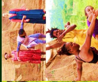
WAF / QDANCE / Gare d'Eseka