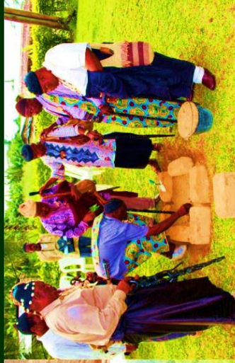
Pose de la Première AISD de Bogso