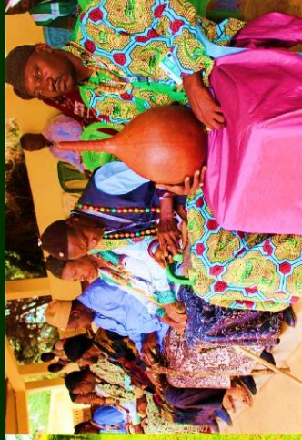
Ndiweto'oh / FOTO / DSCHANG