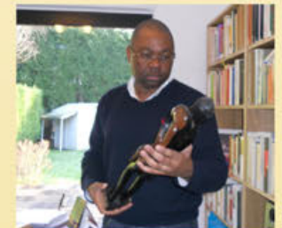
Dr Raoul Nkuitchou NKouatchet

“Apports historiques et contemporains des diasporas dans la pensée et le renouvellement du champ politique au Cameroun”