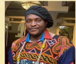
Prince Théophile Tatsitsa

“Le champ de l’inter culturalité comme thérapie individuelle et collective pour les diasporiques”