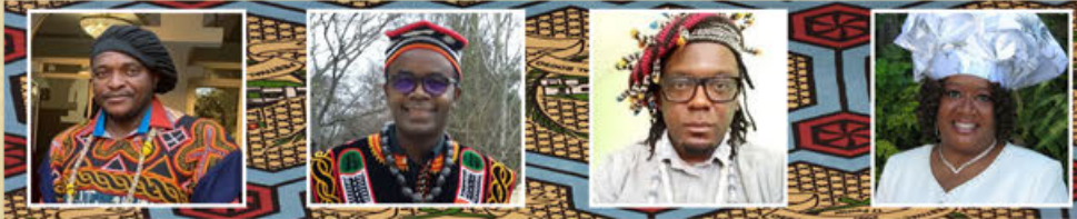
Prince Théophile Tatsitsa Cameroun